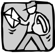
exercer un métier