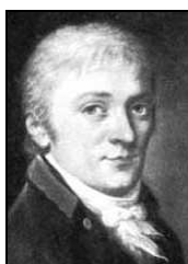
Carl Friedrich GAUSS