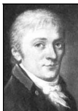
Carl Friedrich GAUSS