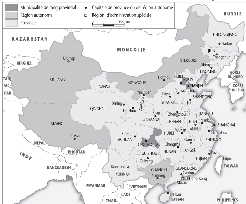
Les régions chinoises

La Chine est aussi touchée par la sécheresse. La province du Hubei en 2005-2006 fut particulièrement touchée comme celle du Sichuan en 2006 ou 5,5 millions de personnes furent privés d'eau potable. Les Chinois ont décidé d'entreprendre de gros travaux pour détourner l'eau des fleuves. Cette sécheresse concerne également les régions de l'ouest de la Chine comme le Xinjiang et les déserts de Takla-Makan et de Gobi.