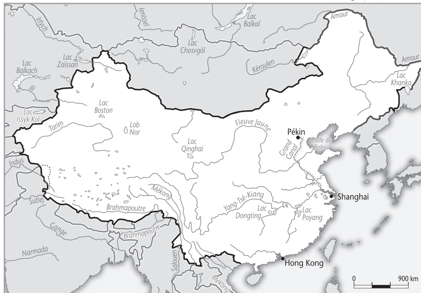
Le réseau hydrographique chinois

En plus de ces fleuves immenses, il existe trois lacs principaux : le Dongting Hu (3 700 km 2 ), le Poyang Hu (3 580 km 2 ), le KoukouNor (4 000 km 2 ).