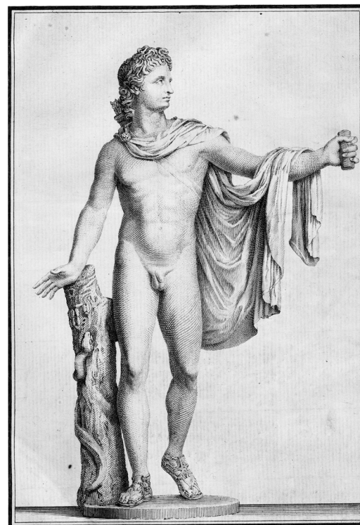
Fig. 2. Le beau idéal selon J.-J. Winckelmann : l'Apollon du Belvédère.