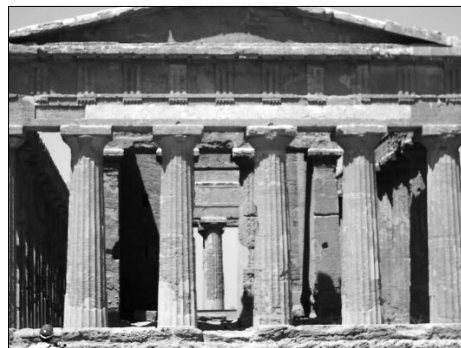
Temple d'Agrigente (Sicile)