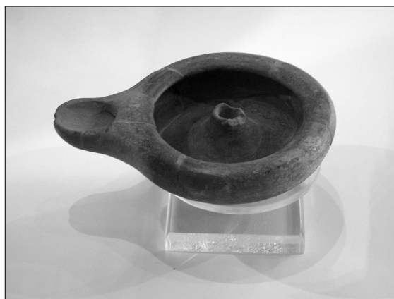
Lampe à huile (musée d'Agrigente)