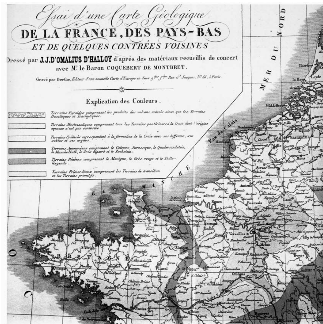
Figure I.1: extrait de la carte de d'Omalius d'Halloy (1822).

dans les substances dominantes d'un terrain formé à la même époque. » (1828 pp. 2-3). On ne peut trouver meilleur argument pour préférer une carte géologique à une simple carte lithologique. Nous y reviendrons plus loin dans le chapitre IV.