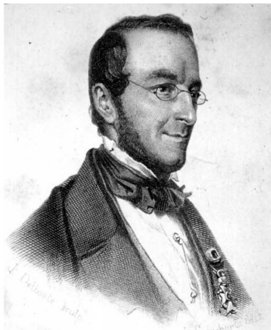
Figure I.2 : deux précurseurs fameux de la cartographie géologique : Jean-Baptiste d'Omalius d'Halloy et André Dumont.