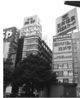
新宿の高層オフィスビル

フィスビルの「森」のような新宿も、若者の好む渋谷も、おしゃれの原宿表参道も、電気・電子製品なら何でもそろう天国のような秋葉原も、それぞれほかの街とまったく違う雰囲気を持っており、東京という巨大で不思議なモザイクを構成しています。