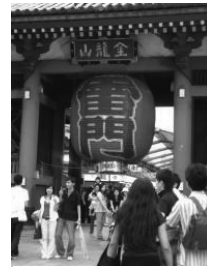
あさくさ かみなりもん 浅草の雷門

「東京」という名称は、明治維新のときに、京都の東の方角にある「東の京都」という意味で付けられました。それ以前は「江戸」と呼ばれていました。平安時代から、天皇の住まいはずっと京都でしたが、17世紀の初めに徳川家がここに幕府を開いたため、江戸は日本の政治の中心地として、だんだんと発展しました。18世紀のはじめごろには、すでに100万人都市となり、当時、世界で一番大きい都市の一つでした。これまでに何回も地震や火事で完全に破壊されながら、いつも10年以内に、惨事以前の大きさに復興してきました。20世紀に