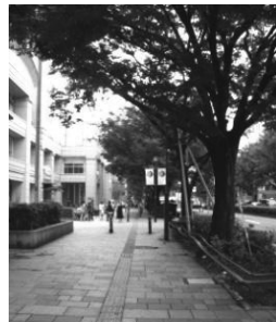
表参道の高級ビル

本州を東京から太平洋にそって西の方へ行くくと、横浜、名古屋、京都、大阪、神戸、広島とつづき、九州に渡って福岡までの大都市が並んで、日本のメガロポリスを形成しています。これらのどの都市も、人口は100万人をはるかに超えています。海岸ぞいのこの細長い地域に、日本の一番重要な工業地帯があり、人口が集中しています。最近では、トンネルを掘ったり、橋をかけたりして、本州を北海道や四国・九州と結ぶ交通網が、かなり発展してきています。