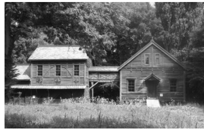
農業大学の昔の建物

日本の北、北海道は本州につぐ 広さを持った島です。気候や風土が ほかの土地と大きく違います。壮大 な山々、数々の美しい湖に囲まれ、 野鳥や動物の支配する原始林と原野 にも出会います。大自然の魅力が一杯です。