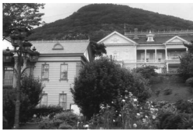
以前の函館市役所

火山地帯でもあることからあちこちに温泉があり、数々の自然 公園が北海道の自然美を誇っています。北海道には、昔から日本人 と異なったアイヌ民族が住み着いていました。彼らは独自のユーカ ラ文化を築き上げました。この文化は口承で、文字が残っていません。